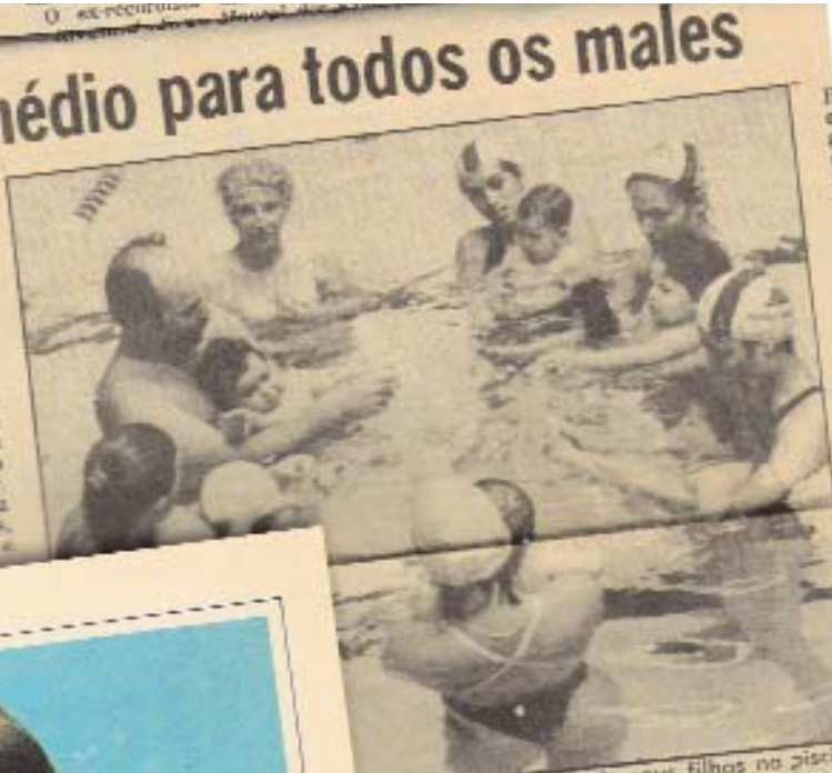
primeiras braçadas de seus filhos na piscina n algumas academias