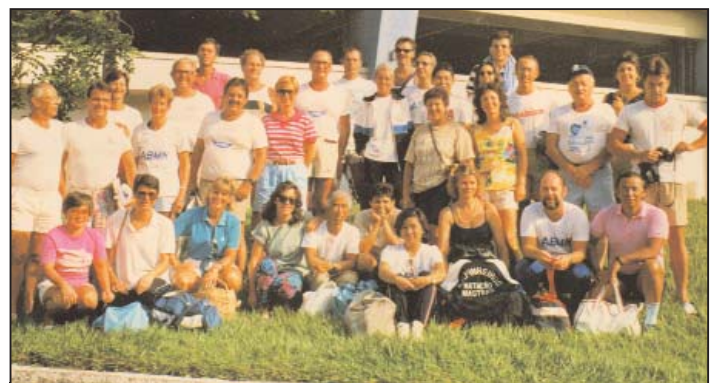
Campeonato Brasileiro 1987 "Masters" - RJ