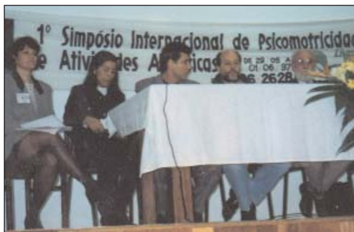
1º Simpósio Internacional de Psicomotricidade - Curitiba