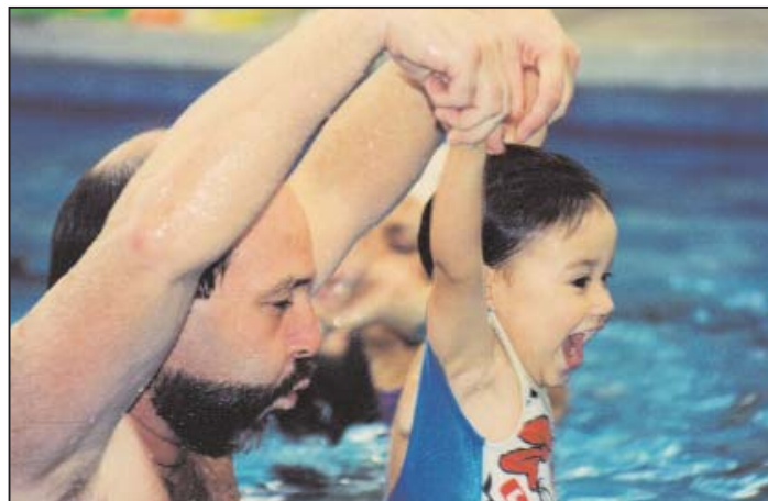
Em aula - "Método Affective Baby Swim"