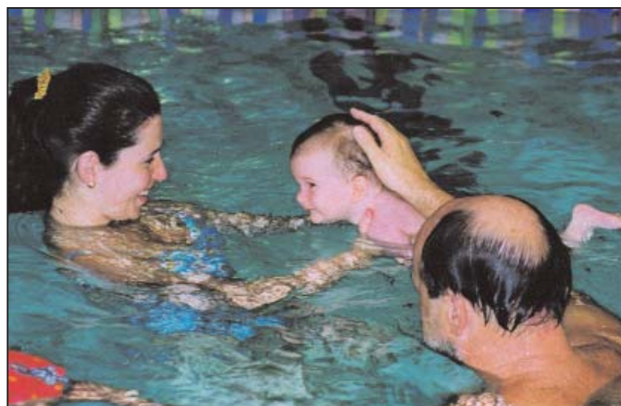
Em aula - "Método Affective Baby Swim"