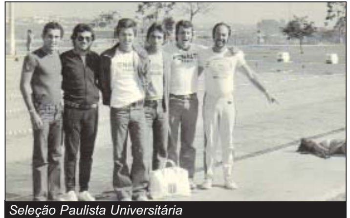
Seleção Paulista Universitária