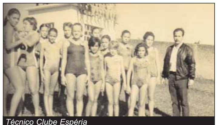
Técnico Clube Espéria