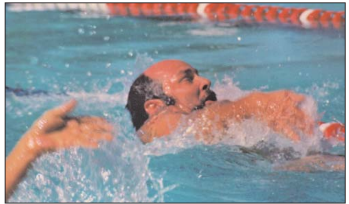
Campeonato Brasileiro 1987 "Masters" - RJ