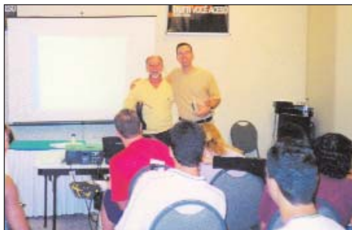
7ª Convenção Centro-Oeste de Fitness - Brasília